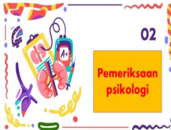
Gambar 4. Pemeriksaan Psikologi