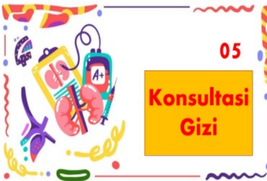
Gambar 7. Konsultasi Gizi