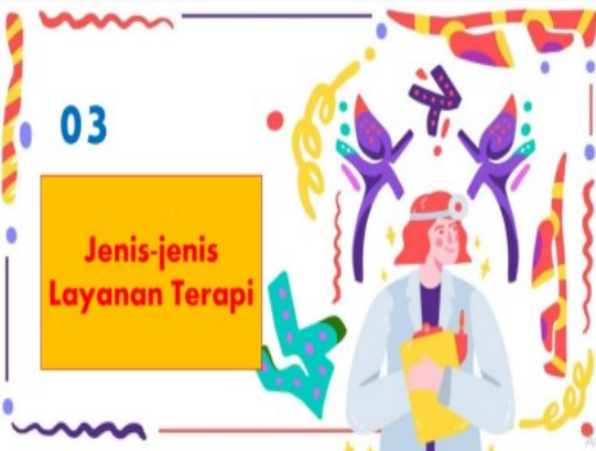
Gambar 5. Jenis-jenis Layanan Terapi