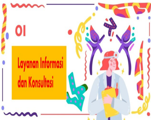
Gambar 3. Layanan Informasi dan Konsultasi