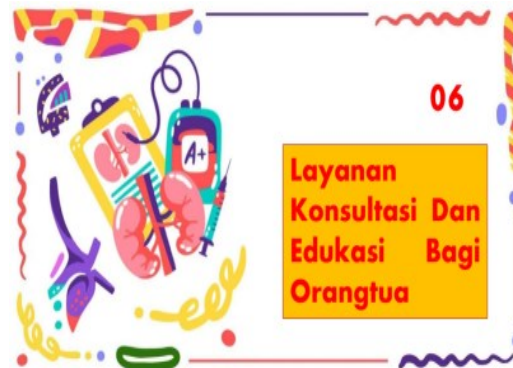
Gambar 8. Layanan Konsultasi dan Edukasi Orang Tua