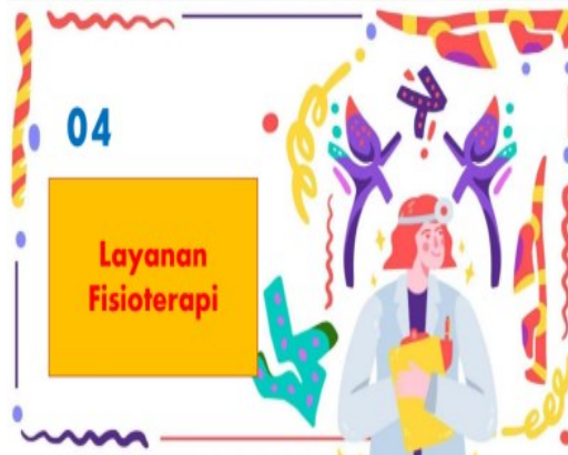
Gambar 6. Layanan Fisioterapi