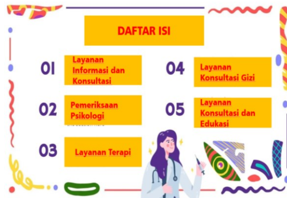
Gambar 2. Daftar isi buku