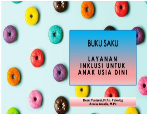
Gambar 1. Cover buku saku