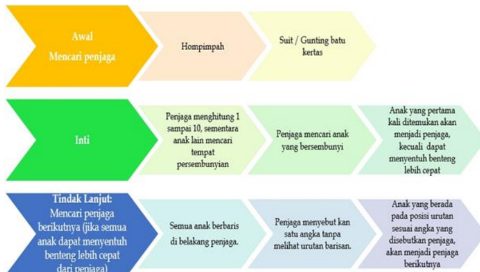
Gambar 8. Proses Kegiatan Bermain Petak Umpet

Berdasarkan pembahasan hasil penelitian tersebut, maka peneliti membuat bagan seperti tampak pada gambar 2 sebagai gambaran proses kegiatan bermain petak umpet: