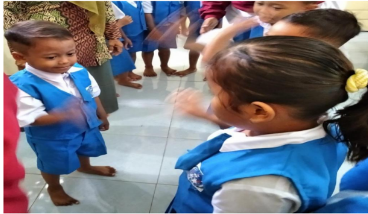
Gambar 3. Kegiatan Suit

Hasil observasi di Kota Semarang, Bekasi, dan Pekalongan; dokumentasi di Pekalongan, dan wawancara di Bekasi menunjukkan bahwa kegiatan bermain dilanjutkan setelah memperoleh satu orang sebagai penjaga. Penjaga harus menutup mata selama hitungan 1 sampai 10, sementara anak-anak lainnya mencari tempat persembunyian. Anak yang sedang menjadi penjaga menyebutkan urutan bilangan 1 hingga 10 secara urut, baru kemudian boleh membuka penutup matanya. Pada umumnya anak menutup mata dengan kedua telapak tangan yang disandarkan pada dinding atau pohon. Pada hitungan ke sepuluh penjaga membuka penutup mata, kemudian mencari teman-teman yang sedang bersembunyi.