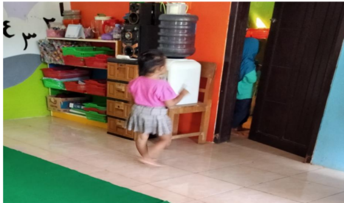
Gambar 6. Mencari Persembunyian Teman

Kegiatan selanjutnya dalam permainan petak umpet yaitu mencari teman-teman yang sedang bersembunyi. Pada saat penjaga menemukan teman yang sedang bersembunyi, penjaga menyebutkan nama anak yang ditemukan kemudian menyentuh tempat ia menutup mata, kemudian mencari teman yang lain, dan begitu seterusnya hingga semua teman ditemukan. Jika semua teman telah ditemukan maka penjaga berikutnya adalah teman yang pertama kali ditemukan oleh penjaga. Namun jika semua teman yang bersembunyi lebih dulu menyentuh tempat penjaga menutup mata, maka penentuan petugas jaga berikutnya dilakukan dengan cara berbaris di belakang penjaga, kemudian, penjaga menutup mata dan menyebutkan salah satu bilangan, anak yang berbaris pada urutan bilangan yang telah disebutkan oleh penjaga akan menjadi petugas jaga berikutnya (hasil observasi di Kota Semarang dan Pekalongan, dokumentasi Pekalongan, dan wawancara Raihan Bekasi).