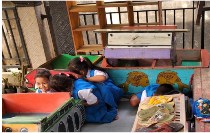
Gambar 5. Kegiatan Bersembunyi Dalam Permainan Petak Umpet

Kegiatan selanjutnya dalam permainan petak umpet yaitu mencari teman-teman yang sedang bersembunyi. Pada saat penjaga menemukan teman yang sedang bersembunyi, penjaga menyebutkan nama anak yang ditemukan kemudian menyentuh tempat ia menutup mata, kemudian mencari teman yang lain, dan begitu seterusnya hingga semua teman ditemukan. Jika semua teman telah ditemukan maka penjaga berikutnya adalah teman yang pertama kali ditemukan oleh penjaga. Namun jika semua teman yang bersembunyi lebih dulu menyentuh tempat penjaga menutup mata, maka penentuan petugas jaga berikutnya dilakukan dengan cara berbaris di belakang penjaga, kemudian, penjaga menutup mata dan menyebutkan salah satu bilangan, anak yang berbaris pada urutan bilangan yang telah disebutkan oleh penjaga akan menjadi petugas jaga berikutnya (hasil observasi di Kota Semarang dan Pekalongan, dokumentasi Pekalongan, dan wawancara Raihan Bekasi).