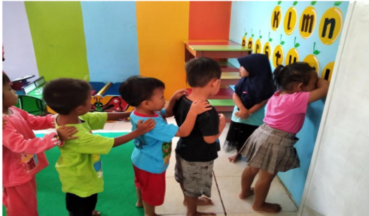
Gambar 7. Menentukan petugas Jaga Berikutnya

Hasil observasi di Kota Semarang dan Bekasi menunjukkan bahwa pengulangan perputaran permainan petak umpet tidak ada ketentuan yang pasti. Kegiatan bermain petak umpet akan berakhir jika anak-anak merasa sudah cukup puas bermain, atau ada kegiatan lain yang harus mereka lakukan, misalnya dipanggil orang tua, sudah waktunya makan, atau sudah waktunya mandi sore.