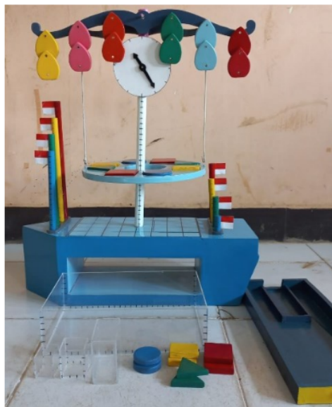
Gambar 4. Hasil Revisi Media Timbangan Konsep Pengukuran

Setelah media dirasa sudah sempurna, peneliti melakukan uji coba. Uji coba pertama dilakukan pada ahli. Peneliti menggunakan 2 ahli dalam melakukan uji coba yaitu ahli dibidang media dan ahli dibidang materi. Hasil dari uji coba ahli disajikan pada tabel 4, 5 dan 6.