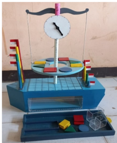
Gambar 3. Media Timbangan Konsep Pengukuran

Adapun langkah selanjutnya; 2) Konsep kemasan media, peneliti disini mulai membuat media dengan bantuan bapak Cipto selaku pengrajin kayu. Media dibuat dengan bahan kayu, besi dan akrilik. Atribut pertama badan kapal, badan kapal dibuat menggunakan kayu dengan ukuran 45 cm namun pada ruang sisi samping kanan di buat menggunakan bahan akrilik seperti sorokkan pada meja dengan ukuran 24 cm x. 15cm, dan dilengkapi dengan gelas ukur dengan bahan akrilik pula, dengan tujuan agar transparan dalam melihat air yang dituang pada wadah. Kegiatan tersebut mencerminkan pada materi volume. Kemudian pada bagian sisi belakang dibuat sorokkan juga seperti pada meja menggunakan bahan kayu, dengan tujuan untuk menyimpan atribut yang berukuran kecil. Kedua, stik yang memiliki ukuran berbeda, stik ini dibuat menggunakan bahan kayu. Ketiga piringan seriasi, piringan ini juga dibuat dengan kayu. Ketiga, tiang penyangga kumis, tiang ini dibuat menggunakan bahan besi kopong dengan ukuran 40 cm. Keempat, kumis timbangan dan buah, kumis dan buah ini dibuat menggunakan bahan kayu, kumis dibuat dengan ukuran 40 cm. Dan kelima jam, jam dibuat dengan bahan kayu dengan ukuran diameter 5 cm. Kemasan media disajikan pada gambar 3.