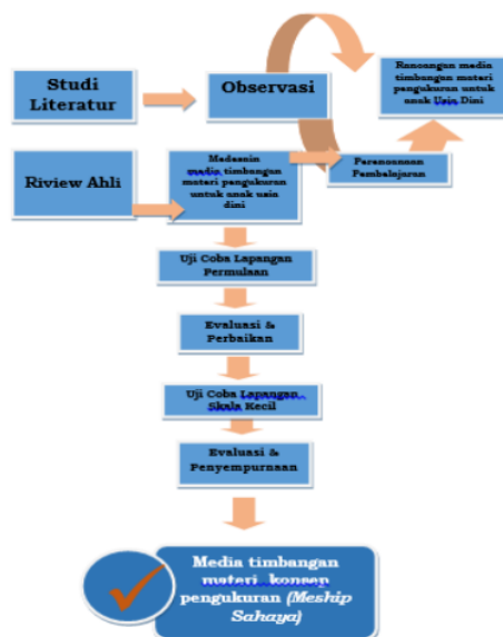
Gambar 1. Model Penelitian Pengembangan

Pelaksanaan penelitian ini menggunakan pendekatan penelitian pengembangan Research and Development (R&D) yang mengacu prosedur model pengembangan dari Borg and Gall. peneliti hanya melakukan 9 prosedur pengembangan, sesuai dengan kebutuhan peneliti. Prosedur tersebut diantaranya: 1) peneliti melakukan analisis kebutuhan dengan cara mengumpulkan informasi terkait permasalahan media yang merupakan variabel penelitian, 2) selanjutnya peneliti merancang media yang menjadi solusi permasalahan dengan memasukkan unsur pembaruan, membuat tujuan penelitian serta mengakumulasi dana dan waktu yang diperlukan nantinya, 3) mengembangkan produk berupa media inovasi awal yang dimodifikasi pada media timbangan materi pengukuran anak usia dini, 4) prosedur berikutnya peneliti menguji produk dengan cara memvalidasi produk pada ahli, peneliti menggunakan 2 yaitu ahli materi dan media, 5) setelah media dinyatakan layak untuk diujikan kelapangan, peneliti melaksanakan pengujian kepraktisan prosuk dengan uji coba lapangan permulaan, 6) hasil dari uji lapangan permulaan menjadi bahan evaluasiproduk untuk melakukan perbaikan pada produk penelitian yaitu media timbangan materi pengukuran untuk anak usia dini, 7) setelah selesai perbaikan maka selanjutnya uji coba lapangan utama, 8) jika dirasa hasil masih kurang maka melakukan perbaikan lagi pada media, 9) dan terakhir melakukan uji lapangan operasional. Selengkapnya disajikan dengan bagan pada gambar 1.