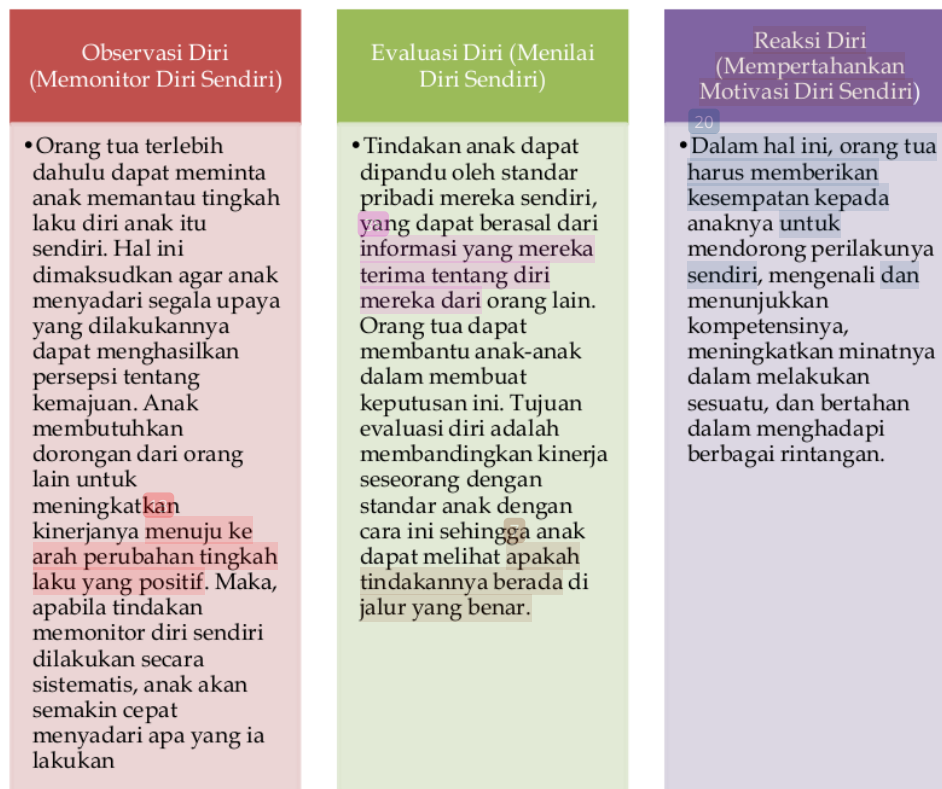
Gambar 4. Bagan kesiapan orang tua pada masa transisi anak

Regulasi diri terutama pada masa transisi ke Sekolah Dasar merupakan komponen penting untuk kesiapan anak di sekolah (Nugraheni et al., 2021). Sudut pandang ini memperhitungkan bagaimana aspek emosional dan kognitif dari pengaturan diri bekerja sama untuk membantu siswa memiliki pengalaman belajar yang positif di kelas (Sa'ida, 2018). Sebagaimana yang dikemukakan oleh Bandura (1989) dalam Kristiyani (2016: 14), definisi regulasi diri bahwasannya lebih memberi penekanan pada regulasi perilaku dan emosi. Barry Zimmerman dalam Friskilia dan Winata (2018: 39) juga mendefinisikan regulasi diri (pengaturan diri) sebagai proses yang digunakan untuk mengaktifkan dan mengatur pikiran, perilaku dan emosi dalam mencapai suatu tujuan. Sementara itu, masa transisi sekolah di definisikan sebagai adaptasi individu secara psikologis, sosial dan pendidikan yang sedang berlangsung karena perpindahan antara satu tempat (sekolah) ke tempat lain, dengan kata lain terjadinya penyesuaian individu dalam berperan serta perubahan konteks dan persepsi anak mengenai diri mereka sendiri dan lingkungannya (Cassoni et al., 2020; Jindal-Snape et al., 2021). Atas dasar inilah, orang tua perlu membantu anak dalam menghadapi kesiapan adaptasi masa transisi dengan mengikuti strategi regulasi diri yang dapat dikembangkan oleh anak (Zimmerman, 1989), sebagaimana disajikan pada gambar 4.