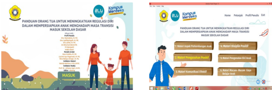
Gambar 3. Pembuatan Produk Media Video Animasi 2D Materi Regulasi Diri Setelah Revisi

Pada tahap ini dilakukan evaluasi terhadap media yang dikembangkan dan isinya berupa kritik dan saran atau masukan. Uji kelayakan media dibagi menjadi dua tahap yaitu tahap pertama uji kelayakan teori dengan pakar di bidangnya ( expert evaluation ), dan tahap kedua uji kelayakan empiris dengan orang tua sebagai pengguna (baik skala kecil maupun skala besar). Berdasarkan feedback dari validator, setiap tahapan dilakukan penyesuaian media. Gambar di bawah ini menggambarkan produk yang diperbarui. Adapun produk hasil revisian tersebut dapat dilihat pada gambar 4.