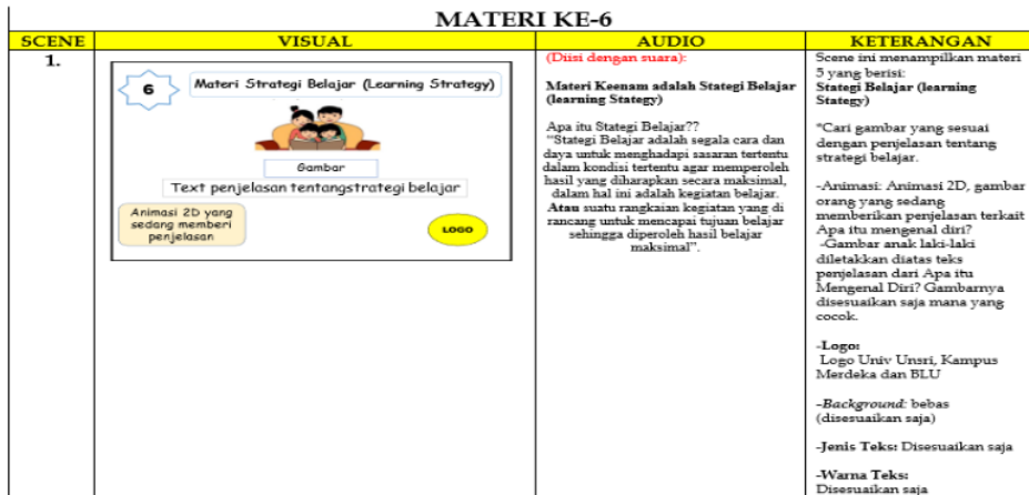
Gambar 2. Prototipe produk media video animasi