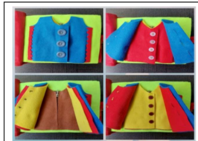
2. Button up clothes