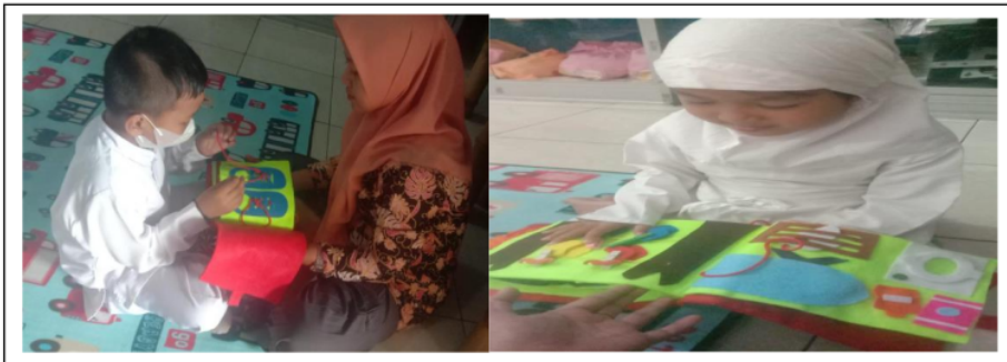
Gambar 3. Tahapan uji coba

Tabel dibawah ini menunjukkan tahapan uji coba.