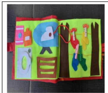
3. Doing laundry