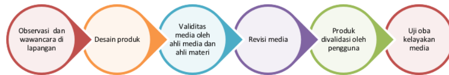
Gambar 1. Desain penelitian

Didalam melakukan 1 penilaian produk, ahli media, ahli materi dan user mengisi skala penilaian sesuai dengan Tabel 1.