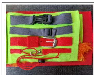
5. Hook and Gesper