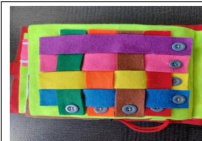
6. Lets Do Braid