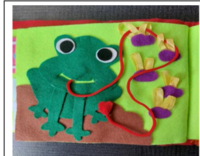
4. Rope and frog